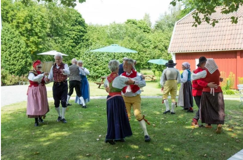
Folkdans vid Ösmo kyrka.